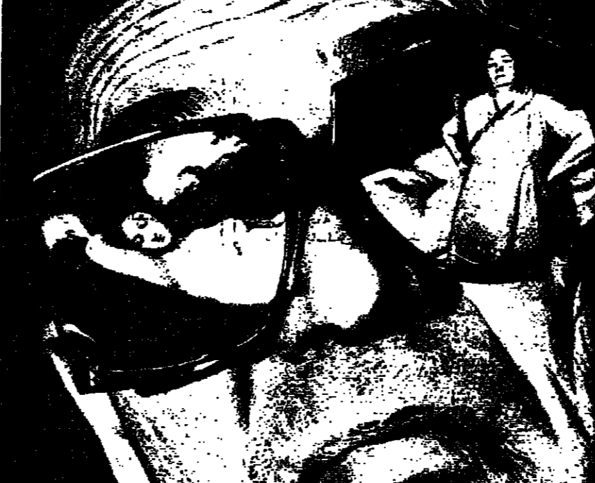
عين لا تفعل - جان صلب العنسة لقب فلان بجائزة مسابقة ارمافير لهواة فن التصوير

حالات انتهاك القانون كما يقولون في أيام القلمته، واهل المدينة وتقريباً عن بكرة أبيهم يحرصون الى المعرض بصحبة صور مضحكة تعرض في مبنى الاستوديو الذي أهده تلبية المدينة لهواة فن التصوير. في هذه المرة كرس معرض الصور الفكاهية لعبيدين ان واحد مرور ١٥٠ عاماً على اختراع التصوير وهورور ١٥٠ عاماً على تأسيس مدينة ارمافير. ولقد ارسل ٨٠٠ هلو أكثر من ٤ الاف صورة أختار لجنة تنظيم المعرض ٢٥٠ صورة منها. ولكن لم تحز الا ١٧ صورة بلفظ الفلتر بجوائز مسابقة التصوير ومنح الفلترزون ديبلومات وميداليات وهدايا تذكارية قيمة، وفاز بعض هواة التصوير بجوائز خاصة. وأحدى هذه الجوائز وهي جائزة «اصحاب جمهور المتفرجين» قد فاز بها ف. جيتنكو هادي التصوير من مدينة فينيسا لقاء صورة «اصوت»، بنعم. ومحت جائزة أخرى لهواة التصوير في بيوتوتو في التي قطعت ١٢ كيلومتر والطائرة والقطار والسراية والسفينة خصيصاً للمشاركة في مسابقة ارمافير ومعرض التصوير مكرس للاحتفال بمرور ١٥٠ عاماً على اختراع التصوير.